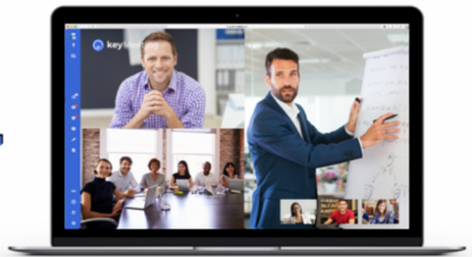
Formazione in aula virtuale