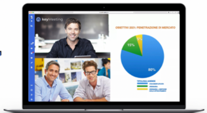
Eventi e webinar